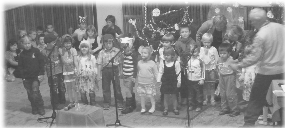
Vánoční besídka 2011